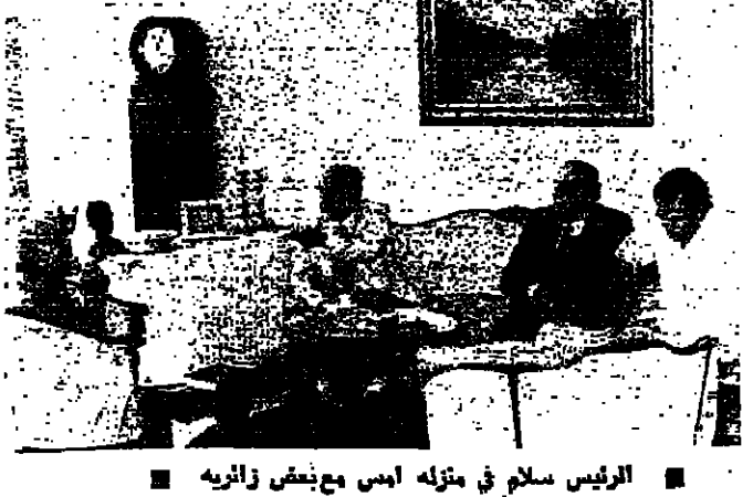
الرئيس سلام في منزله أمس مع بعض زواريه